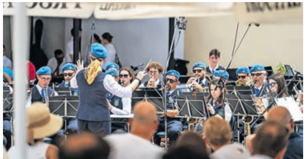
Glavni trg je bil godbeno obarvan. / FOTO: MIRO HRKALOVIČ

Avsenikovi Na svidenje, skladbi Zorba the Greek Mikisa Theodorakisa in drugim znanim melodijam svetovne glasbene zakladnice.