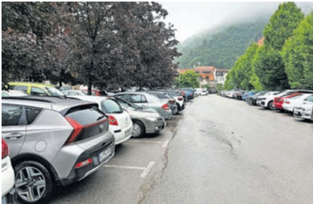
V Kamniku bo jeseni zaživel nov režim parkiranja.