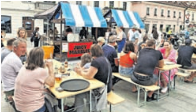
Tako kot na prvi bodo tudi na tretji tekmi nogometne reprezentance navijači lahko okušali dobrote tekmovalcev MasterChefa.

Nato se bo kulinarično dogajanje preselilo na tradicionalno lokacijo v Park Evropa. V petek, 5. julija, bosta za glasbeno spremljavo poskrbeli skupini Smetnaki in Majmunska posla. V petek, 12. julija, bo zaigrala glasbena zasedba Ar'n'Bi. Avgustovska KUL petka bosta minila z nastopom Ane Papedan 9. avgusta in glasbene skupine Mat na kvadrat 16. avgusta. Vselej bo seveda na voljo tudi pestra kulinarična ponudba lokalnih in drugih gostinskih ponudnikov.