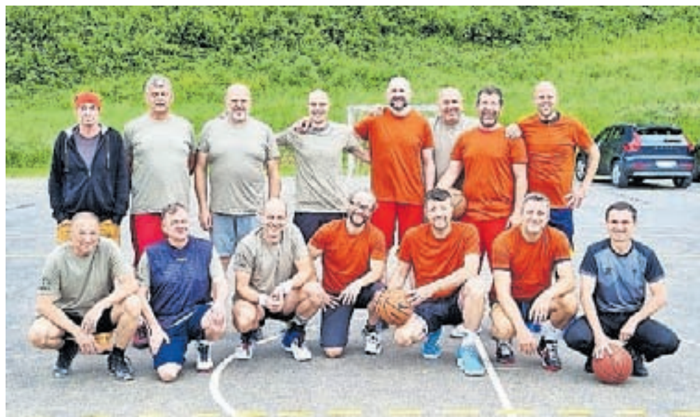
Veterani so se znova pomerili