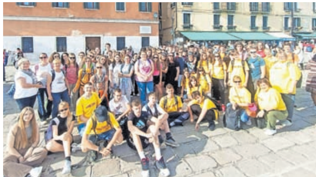
Učenci na izletu v Benetkah

Rialto. Tudi tukaj smo imeli učenci ponovno čas za raziskovanje mesta in njegovih skrivnih kotičkov ter preizkušanja italijanskega sladoleda. Okoli 18. ure se je naše raziskovanje Benetk zaključilo. Z ladjico smo se vrnili do avtobusa in začela se je naša 4-urna pot domov. Med vračanjem je kljub utrujenosti na našem avtobusu zavladalo pravo vzdušje, polno smeha, petja in dobre volje. V Kamnik smo se vrnili okoli 23. ure zvečer. Obisk Italije nam bo za vedno ostal v lepem in nepozabnem spominu. Zagotovo pa to ni bil zadnji obisk Benetk in otoka Burano, marsikdo izmed nas ga bo še obiskal. V imenu vseh učencev občine Kamnik, ki smo opravili bralno značko vseh 9 let, se najlepše zahvaljujemo vsem