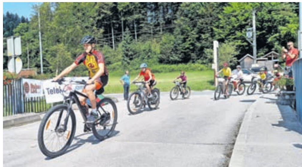
Pomerilo se je tudi veliko mladih kolesarjev

tin Močnik, SLO Cycling. Kako hitri so bili, pove izračun, da bi bil osebni avtomobil, upoštevajoč prometne predpise po regionalni cesti, šele četrta s petimi minutami zaostanka. Ko so tekmovalci še brzeli proti Črnivcu, pa so bili člani Turističnega društva Tuhinjska dolina z mislimi že v prihodnosti. Tekmovalci, športni veljaki in novinarji so pohvalili, da je organizacija na veliko višjem nivoju kot na marsikateri slovenski dirki. Naslednje leto bo pri