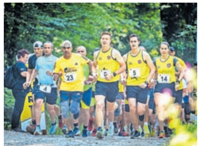
Tečem, da pomagam

Pomemben dogodek, ki so ga obudili prvič po preteku obdobja epidemije covid-19, pa je dobrodelni tek Tečem, da pomagam, ki je veljal tudi kot eden od tekov Tekoškega pokala Občine Kamnik. Start je bil pri Športnem parku Podgorje, nato je potekal po gozdni cesti do obračališča Pr' Jeršin in spet nazaj. Mlajše kategorije pa so se podale