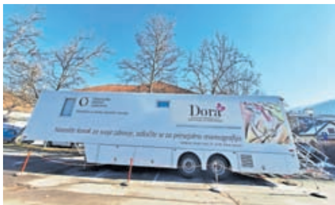
Mobilna enota programa Dora, kjer poteka slikanje žensk, se bo v Kamnik vrnila čez dve leti.

Kot so pojasnili na Onkološkem inštitutu Ljubljana, je rak dojke še vedno najpogostejši rak pri ženskah. Okoli 1.500 jih vsako leto na novo zboli, približno 80 odstotkov vseh zbolelih pa je starejših od 50 let. »S presejalno mamografijo, ki je s strokovnimi raziskavami dokazano najbolj varna in učinkovita metoda za odkrivanje zgodnjih raka-vih sprememb v dojki, lahko v programu Dora odkrijejo bolezenske spremembe, ki jih ženska sama še ne more zaznati,« so pojasnili, ob tem pa dodali, da zgodaj odkrit rak dojke praviloma pomeni večjo verjetnost ozdravitve, samo zdravljenje pa je manj obsežno, kar lahko vpliva na kakovost življenja bolnic z rakom dojke. V programu Dora zato ženskam svetujejo, da se redno udeležijo preventivne mamografije.