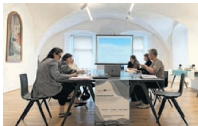
Projekt Commheritour sofinancirata Evropska unija iz programa Interreg Danube Region in Občina Kamnik.

Po triurni razpravi na prvi delavnici so se deležniki strinjali, da je eden ključnih problemov vrednotenja kulturne dediščine pomanjka-