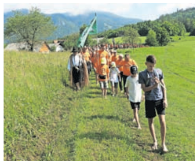
Pohoda se je udeležilo 125 bosonogih.

ko drevja, tako da so imeli organizatorji zelo veliko dela, da so pot na vrh Vovar-