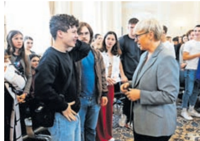
Dijaki v pogovoru s predsednico Natašo Pirc Musar

Ljubljana – V sredo, 29. maja, se je skoraj 120 kamniških gimnazijek in gimnazijcev odpravilo na ekskurzijo v Ljubljano, ki je potekala v okviru obveznih izbirnih vsebin ter aktivnega državljanstva. Slednje je predmet, pri katerem dijaki med drugim spoznavajo tudi delovanje države ter njenih institucij, zato smo se letos odločili za ogled in spoznavanje Predsedniške palače. Vrh obiska je predstavljal sprejem in pogovor s predsednico republike, Natašo Pirc Musar.