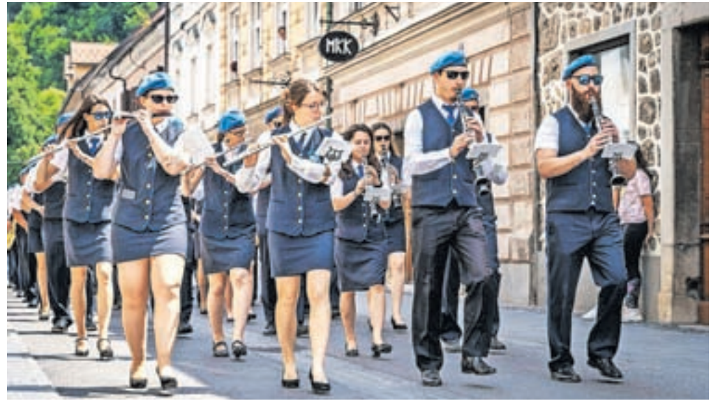
Godbeniki Mestne godbe Kamnik

Program mestne dobe pa je bil tematsko obarvan. Izvedli so svetovne plese paso dole, valček, bossa nova, rumba, sirtaki, tango, samba, gopak in polka. Obiskovalci, ki se jih je ob lepem vremenu zbralo precej, so tako lahko prisluhnili Valčku št. 2 Dmitrija Šostakoviča, Libertangu Astorja Piazzolle,