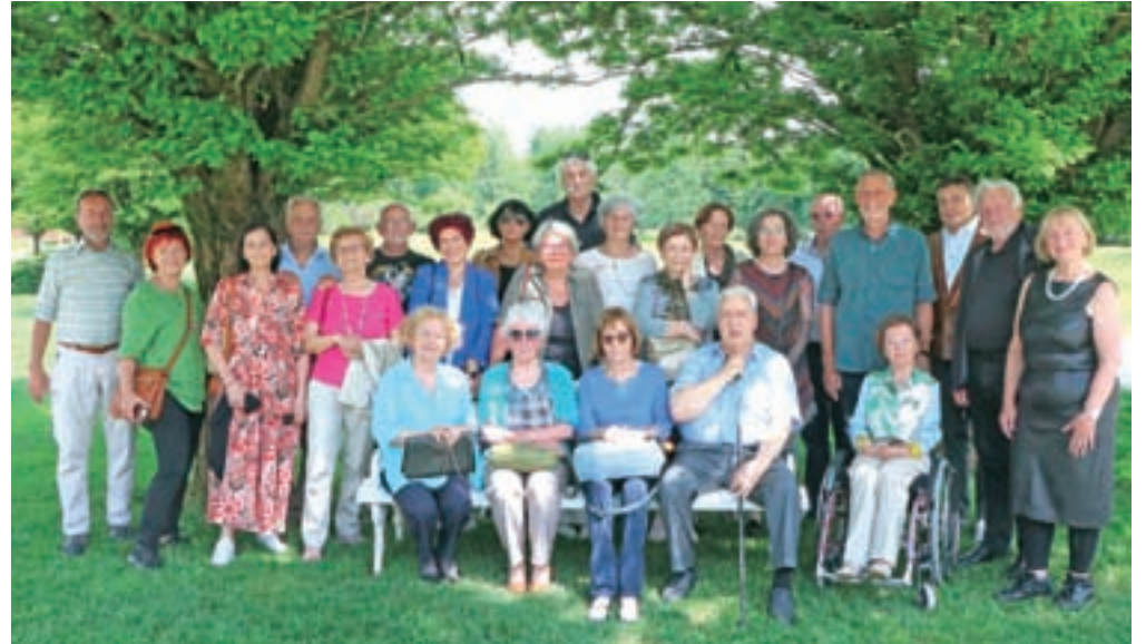
Gimnazijci so se ob petinpetdeseti obletnici mature tokrat srečali v Arboretumu Volčji Potok.