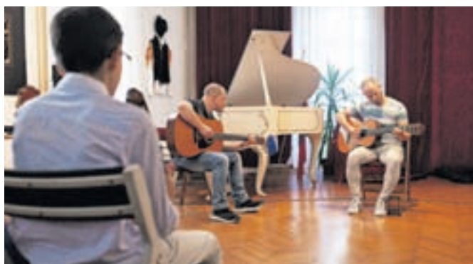
V šoli se uči tudi nekaj odraslih, a so se le redki opogumili za nastop pred publiko.

slih, ki so za inštrument poprijeli v kasnejših letih. »Nastopila je velika večina naših učencev. Vse namreč spodbujamo, da čim več nastopajo in se na ta način znebijo treme, kar jim lahko prav pride tudi na drugih področjih življenja,« je povedal Skalar, ki pravi, da je zanimanje za igranje inštrumentov vsako leto večje, medse pa bi lahko sprejeli še več učencev, če bi imeli na voljo dovolj učiteljev.