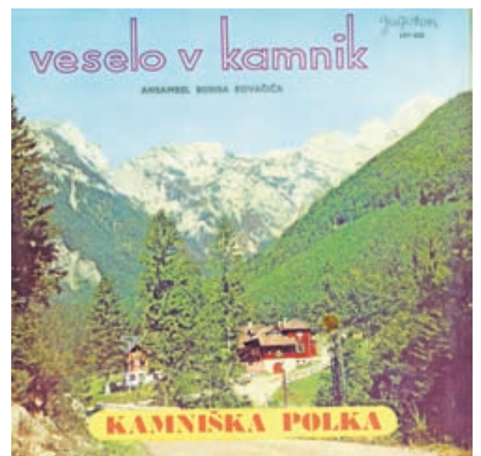
Naslovnica plošče Veselo v Kamnik, 1965

V drugi polovici šestdesetih let 20. stoletja se je začela zmagoslavna pot te pesmi.