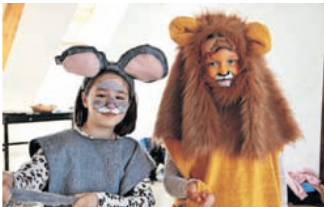
Učenci v okviru delavnice izvedejo glasbeno-gledališke predstave Lev v srcu.