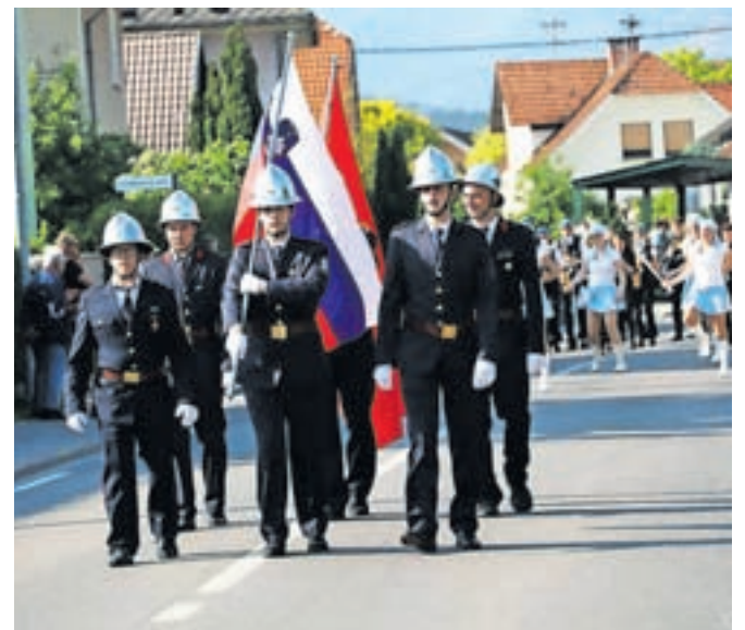
Parada ob 40-letnici PGD Šmarca

Transporter. Zadnja pridobitev PGD Šmarca pa je gasilski poligon med tovarno Menina in Kamniško Bistrico. »S pomočjo donatorjev ga bomo dokončali v naslednjih tednih,« je napovedal Jemec in dodal, da bodo z novim poligonom omogočili pogoje za še boljše delo z mladimi gasilci, ki jih je trenutno v društvu 65. »Želim si, da bi se še dolgo vključevali v gasilske vrste, se učili gasilskih veščin in kot odrasli nadaljevali razvoj gasilstva v Šmarci in širše,« je ob tem dodal.