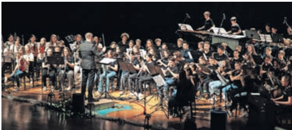
Praznovanje sedemdesetletnice Glasbene šole Kamnik v Športni dvorani Kamnik

»Naloga Glasbene šole je omogočiti najširšim ljudskim slojem vsestransko glasbeno šolanje, vzgajati glasbeni naraščaj za strokovno šolanje ter vzbuhati, dvigati in gojiti estetski čut in kulturno raven svojega območja z glasbenimi produkcijami in javnimi nastopi,« so pred sedemdesetimi leti zapisali v ustanovitveni sklep. In glede na videno v kamniški športni dvorani, kjer je potekal koncert, učiteljskemu zboru zadane cilje tudi po sedemdesetih letih odlično uspeva uresničevati in glasbeno znanje prenašati na mlade.