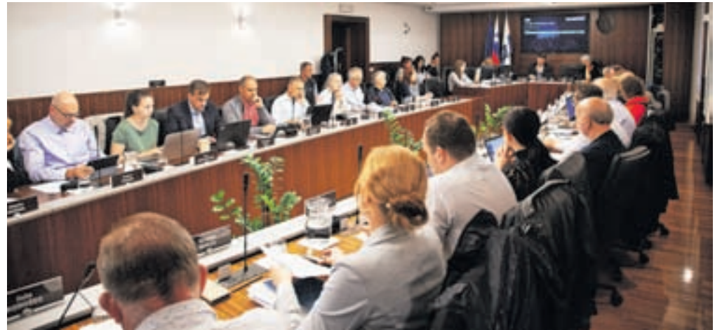
Konec maja so se svetniki zbrali na četrti redni seji v tem mandatu.

Na področju zagotavljanja varnosti cestnega prometa so policisti obravnavali 1590 kršitev, kar je 30 odstotkov manj kot leto prej. Manj je bilo kršitev prekoračitev hitrosti, prekomerne uporabe alkohola in kršitev pri uporabi varnostnega pasu. Kot ugotavljajo na kamniški policijski upravi, upad tovrstnih kršitev kaže na čedalje večjo ozaveščenost udeležencev cestnega prometa. Na območju občine so se lani zgodile 204 prometne