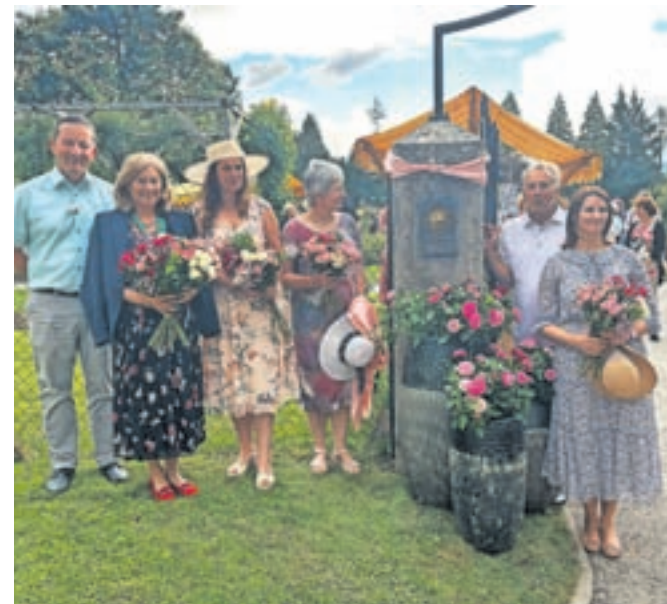
Ob spominski plošči za prejeto priznanje za vrtno odličnost