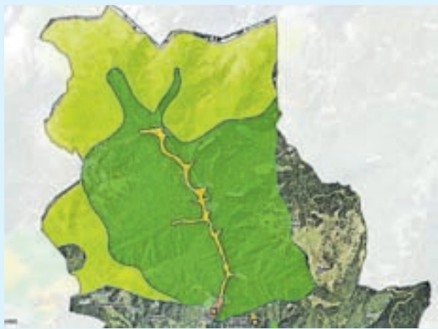
Vodovarstvena območja

Lastniki oziroma uporabniki koč lahko odvoz gošč naročijo po elektronski pošti (odvozi@kamnik.si) in po telefonu (031 785 803). Cena sistematičnega črpanja in čiščenja odpadnih voda za posamezen objekt na podlagi veljavnega cenika znaša 61,75 evra (z DDV-jem). Odvoz do Centralne čistilne naprave Domžale - Kamnik bo tudi v letošnjem letu financirala Občina Kamnik. Če se lastniki objektov za prevzem grezničnih gošč ne boste odločili, odvoza pa niste uredili v zadnjih treh letih, boste morali najkasneje do 30. 8. 2023 na elektronski naslov odvozi@kamnik.si ali po pošti na naslov Občina Kamnik, Glavni trg 24, 1241 Kamnik, predložiti potrdilo o zadnji oddaji grezničnih gošč v Centralno čistilno napravo Domžale - Kamnik.