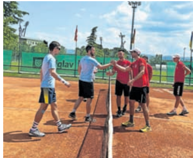
Igralci Tenis kluba Kamnik so se uvrstili v zaključno tekmovanje najboljših štirih ekip, ki nastopajo v 3. slovenski ligi za člane.