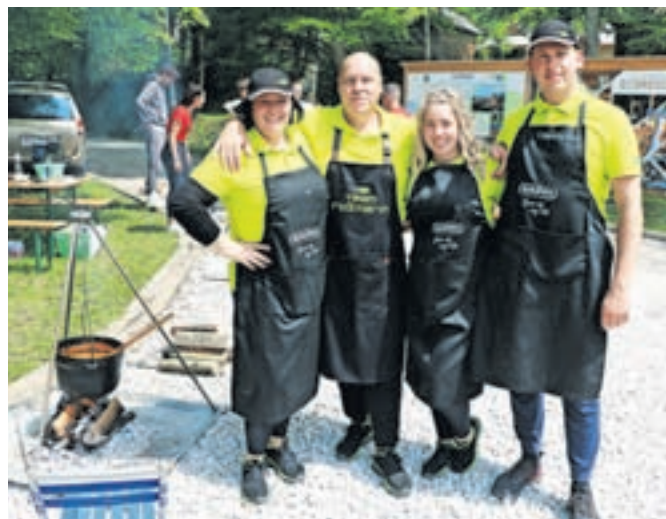
Domači Team Rožmarin

kar družinsko. Eni so pražili čebulo le pol ure, drugi tri ure. Tudi kurišča so se med seboj razlikovala – kotle so namreč tekmovalci priskrbeli sami, okoli njih pa je bilo prav veselo. Tudi vreme jim je šlo na roko. Med ekipami, ki so bile tako rekoč iz vseh vetrov, smo zasledili zanimi-