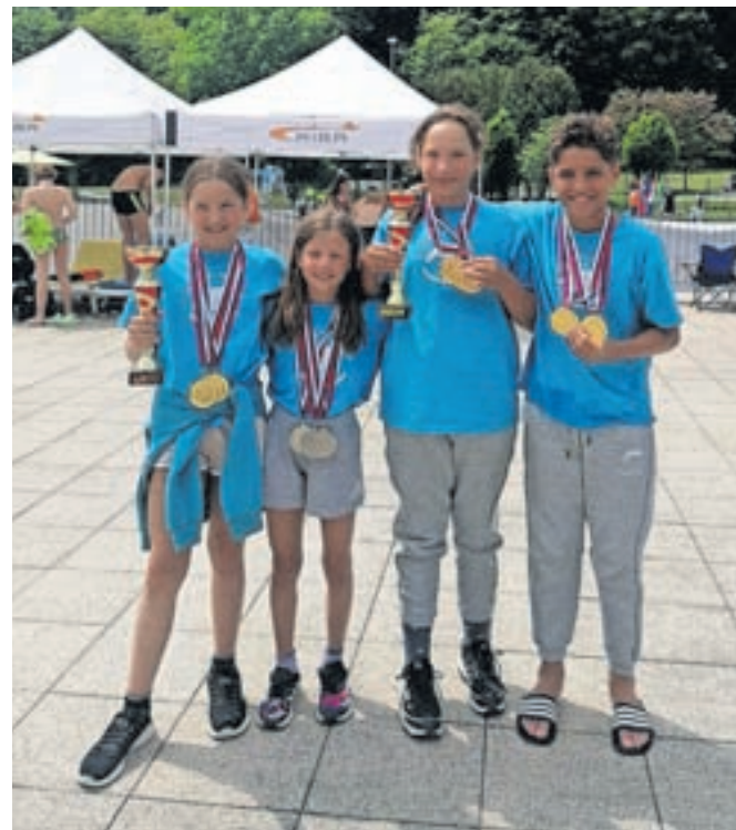
Dobitniki odličij v kategoriji mlajših deklic in mlajših dečkov v Krškem

V soboto, 27. maja, je na bazenu v Brestanici potekal 6. Razvojni pokal in 52. Pokal Krško 2023. Na tekmovanju je nastopilo 425 plavalcev iz devetnajstih slovenskih in enega tujega kluba. Plavalni klub Calcit Kamnik je zastopalo šestnajst plavalk in plavalcev starostnih skupin mlajše deklice in mlajši dečki ter deklice in dečki pod vodstvom trenerke Lare Se-