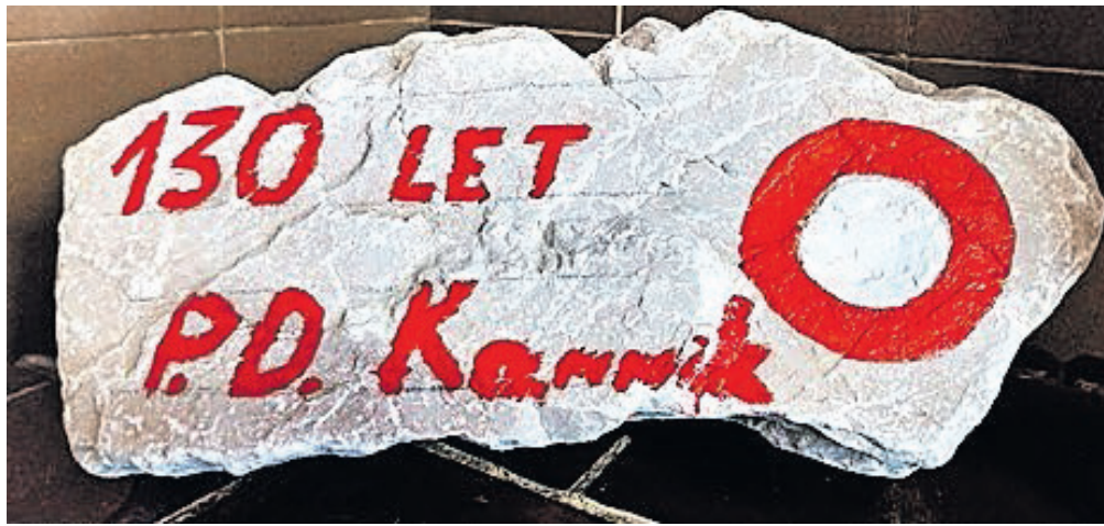
Planinsko društvo Kamnik letos zaznamuje 130 let.

V Sloveniji se področje varovanja gorske narave sistematično ureja v okviru Komisije za varstvo gorske narave (KVG), ki je strokovni koordinacijski organ PZS. Odssek za varstvo gorske narave ima tudi večina planinskih društev. Varuhi gorske nara-