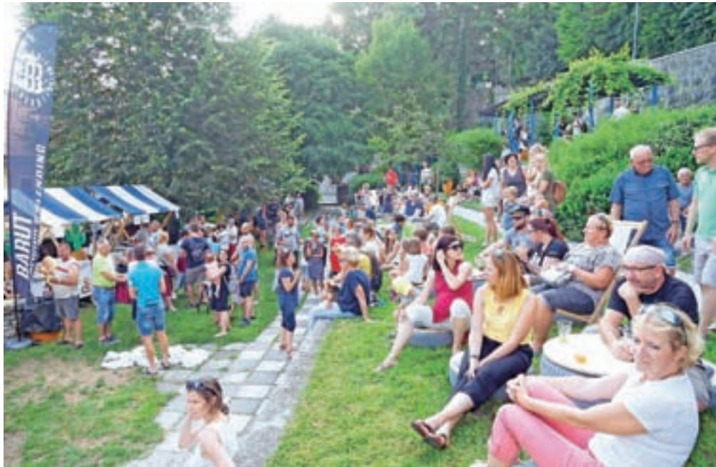
Prvi Kul petek v poletni sezoni je obiskalo več kot tisoč ljudi.