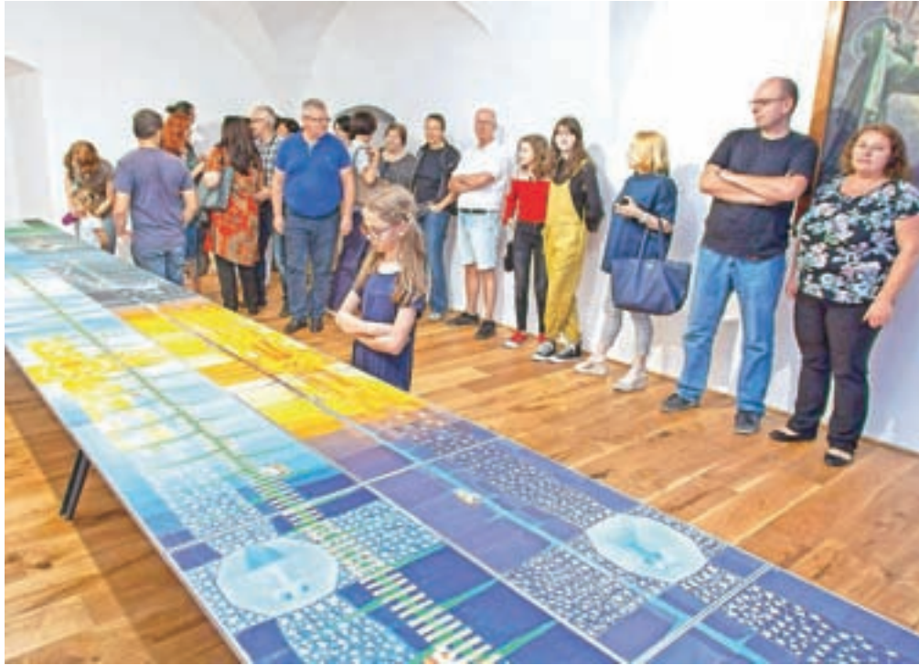
Ob predstavitvi knjige so si obiskovalci lahko ogledali tudi originalne ilustracije Tomaža Schlegla.

Vzpona in sestopa z drevesa bralec ne občuti zgolj skozi besedilo in ilustracije, temveč se odraža tudi v inovativnem oblikovanju in vezavi knjige, nad katero je bdela oblikovalka Silva Vovk Kete. Ko se Vita vzpenja po drevesu, bralec liste obrača »navzgor«, ko zgodba doseže svoj vrh in se Vita poda