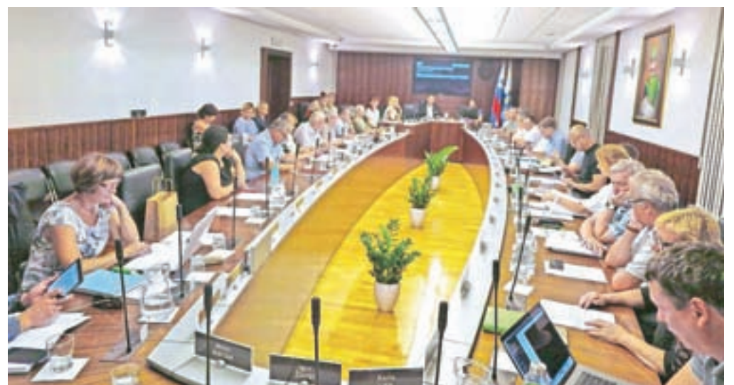
Občinski svetniki na junijski seji

V letih 2019 in 2020 je predvidena izdelava potrebne projektne in investicijske dokumentacije in ureditev lastninskopravnih razmerij, v letih 2021 in 2022 pa bo