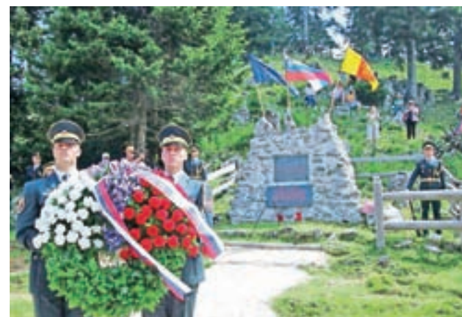
V začetku julija je na Menini planini potekala vsaokoletna slovesnost v spomin na NOB.

Dotaknil se je tudi položaja Slovenije v Evropski uniji: »Ni dovolj samo reči: mi smo v Evropski uniji, zdaj