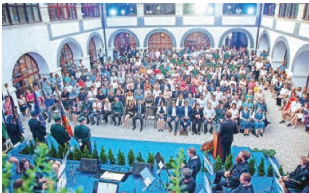
Proslava ob dnevu državnosti je potekala na notranjem dvorišču Samostana Mekinje.

»Čeprav je bila za osamosvojitve Slovenije odločilna zmagava Demosa, njegova vloga v procesu osamosvajanja ni ekskluzivna. Ne glede na vse, slovenskim komunistom ni mogoče odreči njihovega deleža v procesu demokratizacije in osamosvajanja. Sloven-