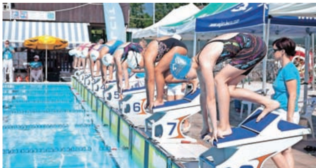
Kamniški plavalni miting Veronika je letos privabil 332 plavalcev.

Veronikin miting ponuja eno zadnjih možnosti za izboljšanje osebnih rezultatov na petdeset in sto metrov ter doseganje norm za uvrstitev na državno prvenstvo, zato je privabil nekaj najboljših slovenskih tekmovalcev,