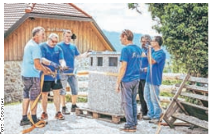
Na Gori so namestili tri koše za ločevanje odpadkov.