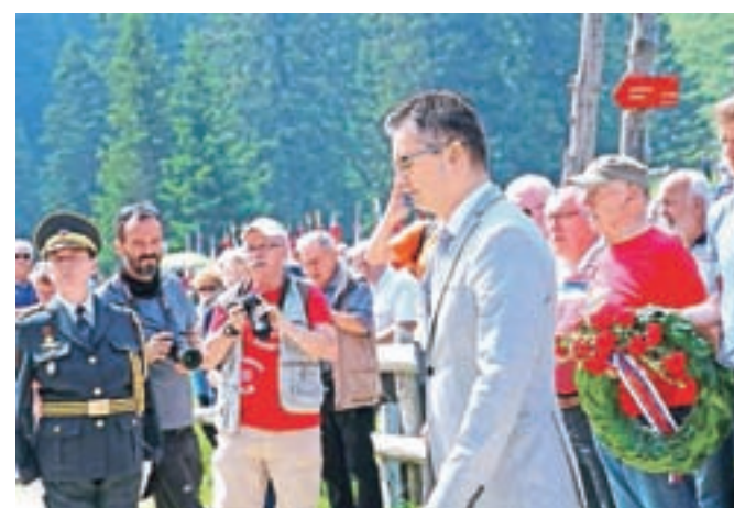
Prireditve se je udeležil tudi predsednik vlade Marjan Šarec.

za narod, za svobodo, je vredno, da se objokuje. Hkrati se je treba zavedati, da smo žrtvam dolžni, da naredimo vse za svojo državo in da jo imamo radi,« je povedal Šarec, ki se je dotaknil tudi aktualnih razmer in težav.