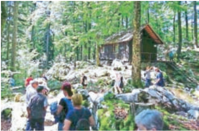
Območje Baze 20

Spomenik NOB na Cvibljju stoji na 305 metrov visoki vzpetini, imenovani tudi Tumulac, ki se dviguje nad Žužemberkom. Spomenik z grobnico, v kateri so pokopani posmrtni ostanki padlih, je bil postavljen v spomin na 1140 padlih partizanov, ki so izgubili svoje življenje v bojih v Suhi krajini. Po spominskem obeležju smo člani zapeli nekaj partizanskih pesmi. Grad Žužemberk je ena najslavnejših in najbolj tipičnih srednjeveških trdnjav na Slovenskem. Njegovi ostanki se mogočno dvigujejo na strmih skalovju nad reko Krko. Kamnita vrata štirioglatega stolpa naj bi imela vklesano letnico 1000, kar priča, da je dal grad verjetno postaviti Viljem I.