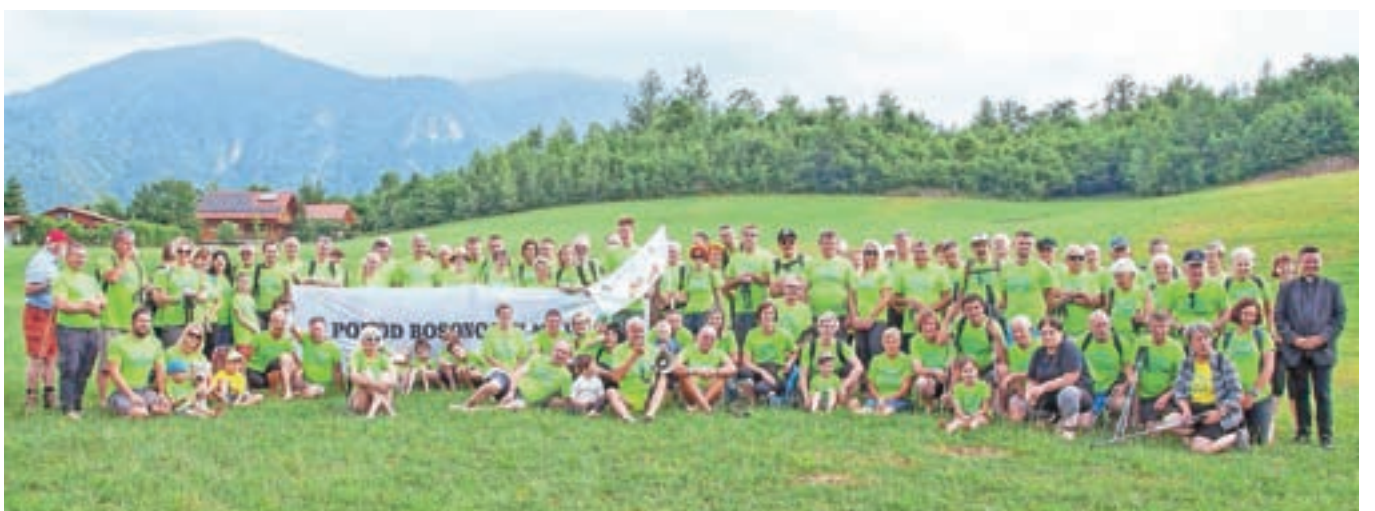
Četrtega pohoda na Vovar se je udeležilo 125 bosonogih pohodnikov.