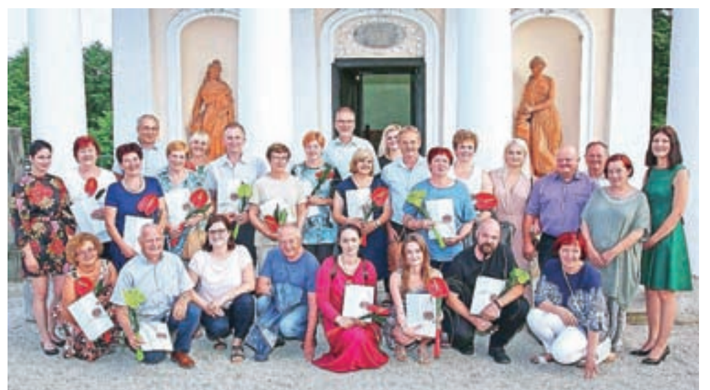
Prejemniki certifikata kolektivne tržne znamke Srce Slovenije po slavnostni podelitvi v Erbergovih paviljonih graščine Dol