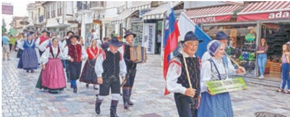
Člani Folklorne skupine Kamnik so prvič nastopili na tovrstnem festivalu v Ohridu.