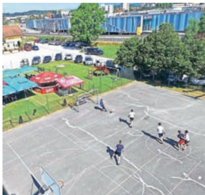
Igralci so prikazali zelo napete obračune.

Šestnajst prijavljenih ekip se je v prvem delu tekmovanja, ki se je začel s tekmami ob 8.30, merilo v štirih skupinah, v četrtfinalne obračune pa sta se uvrstili po dve najboljši ekipi iz posamezne skupine. Po razburljivih polfinalnih obračunih so sledile prave poslastice dneva v polfinalu in finalu, kjer smo spremlja-