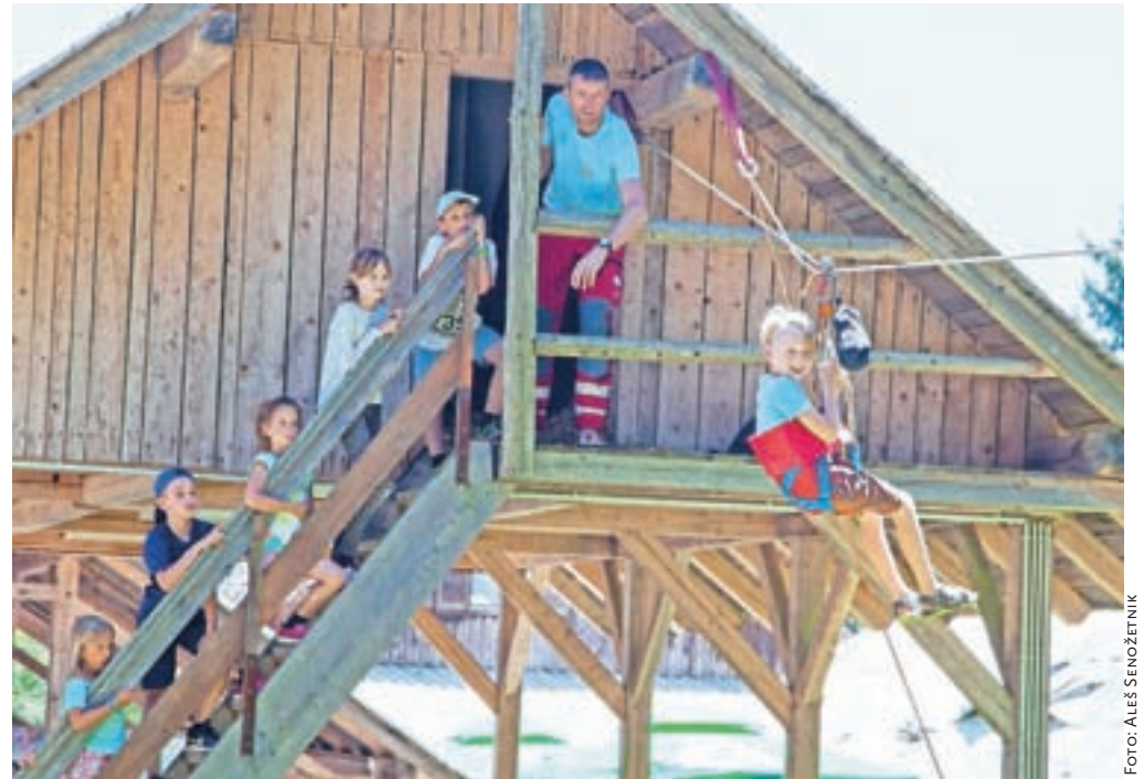
Organizatorji so na Dnevu kamniških planin še zlasti poskrbeli za dobro voljo najmlajših.