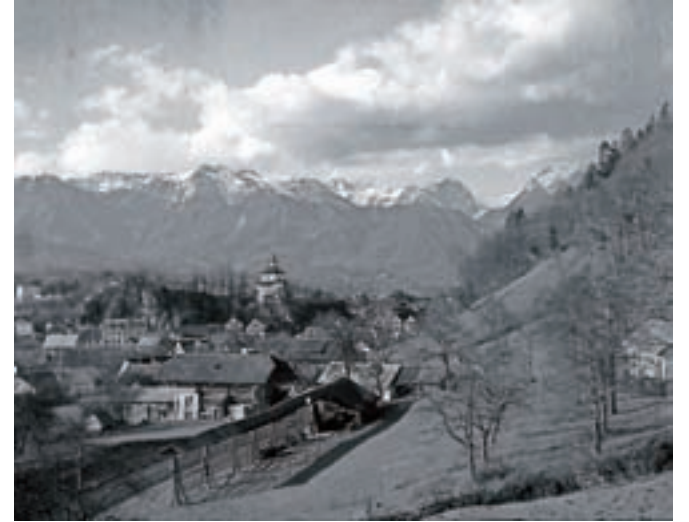
Pogled na Kamnik leta 1933

Njemu lasten odnos do Boga mu je nudil zatočišče pred dilemami, ki doletijo človeka v vsakdanjem življenju. Seme duhovnosti mu je bilo položeno v zibko, kar ga je spremljalo na poti duhovnega iskanja. Ob tem pa je v njem raslo zanimanje za romanja, kjer si je nabiral globoke vtise in širil svoje duhovno obzorje. Leta 1908 se je udeležil prvega vseslovenskega romanja v francoski Lurd, takrat še brez svojega fotoaparata, o samem romanju pa se je ohranil dnevnik. Že čez dve leti se je s 540 romarji udeležil prvega vseslovenskega romanja v Sveto deželo pod duhovnim vodstvom ljubljanskega knezoškofa Antona Bonaventure Jegliča, Peter pa je s svo-