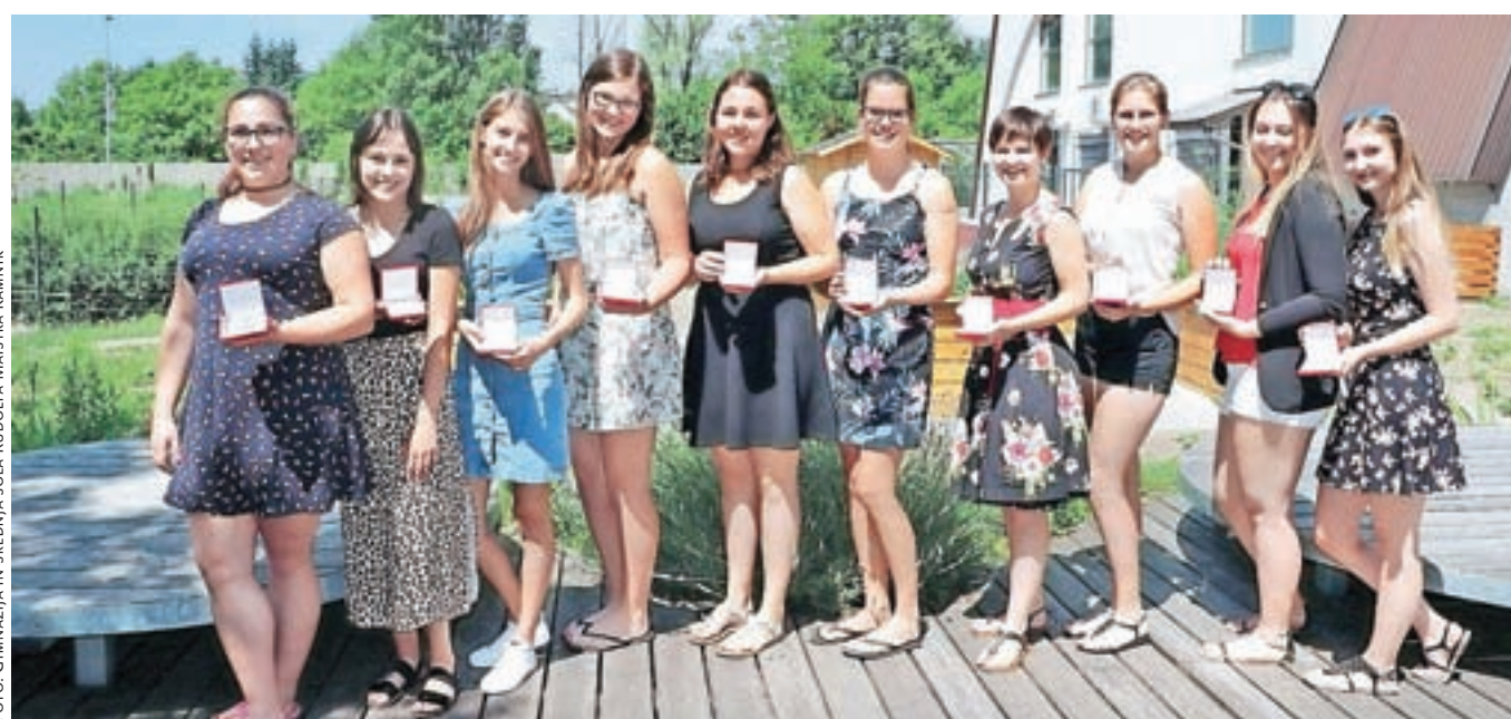
Zlate maturantke poklicne mature so bile na podelitvi spričeval razumljivo zelo prešerno razpoložene.

narda Trstenjak, čestitkam pa so se pridružili tudi razredniki, učitelji ter ostali zaposleni na šoli.