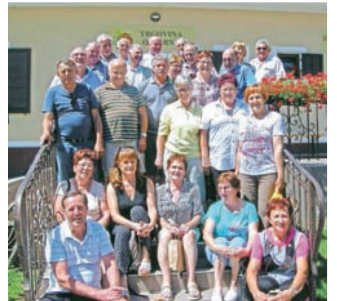
Nekdanji sošolci Osnovne šole Vransko, med njimi jih je tudi nekaj iz Motnika in Špitaliča

V Gorišnici smo se ustavili za kavo in prigrizek, potem smo obiskali Oljarno Središče ob Dravi. Po predstavitvenem filmu smo degustirali bučne proizvode in nakupili