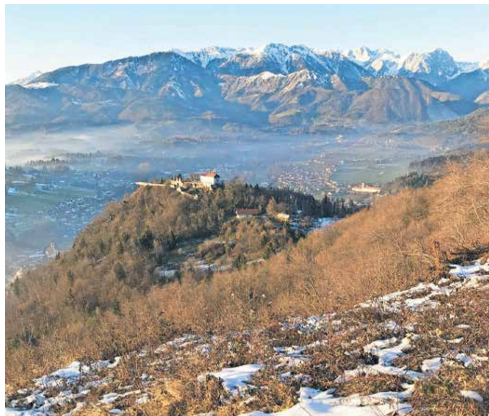
Gostišče na starem gradu čaka na novega najemnika.

»Stari grad ima za občino Kamnik izjemno zgodovinsko, turistično in rekreativno vrednost. Je del kamniške identitete in naša dolžnost je z njim ravnati nadvse skrbno in odgovorno. S koncem lanske poletne sezone je prejšnji najemnik gostišča na Starem gradu zaključil najem. Takoj po prekinitvi najemne pogodbe so na Zavodu za turizem in šport Kamnik aktivno pristopili k reševanju problematike. Opravili so posvete s potencialnimi novimi ponudniki (in tudi z nekdanjimi najemniki), da bi pridobili informacije, kaj in