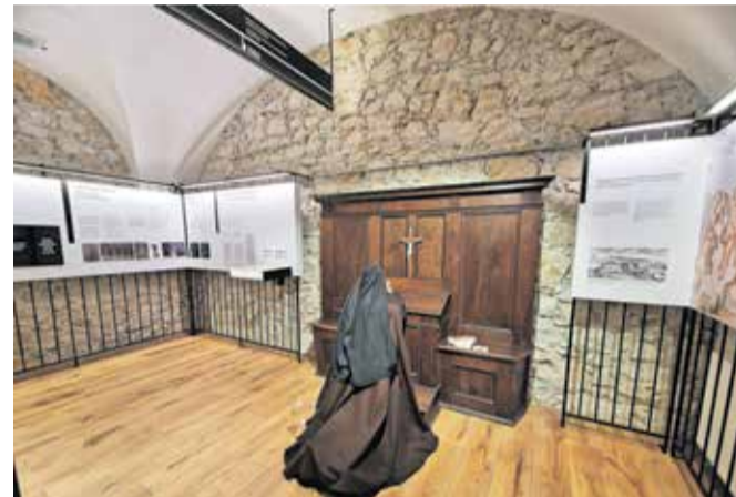
Udeleženci Bralnega maratona so si ogledali mekinjski samostan.

Bralno kondicijo smo nabirali s knjigami na temo poletja, družine, športa, osebne rasti in še mnoge druge. Na start smo se podali 8. februarja. Proga je bila dolga, vendar izredno zanimiva, saj smo morali v roke prijeti tudi takšno knjigo, ki ni po našem okusu. S tem smo razširili svoja obzorja in se veliko novega naučili. Knjiga nas lahko presenetiti z zanimivimi zgodbami in spoznanji, če ji le znamo prisluhniti.