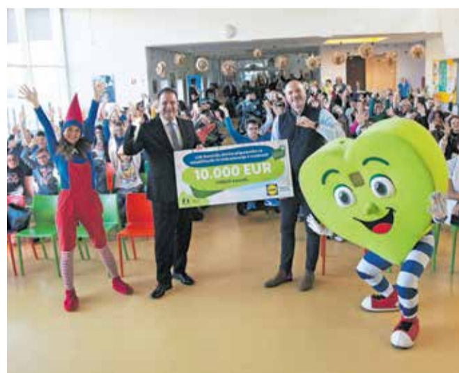
Ob simbolični predaji čeka so v Ciriusu pripravili tudi kratko prireditev.

Kamnik – Poleg Ciriusa Vipava je bil kamniški del Centra za izobraževanje, rehabilitacijo in usposabljanje prejemnik letošnje donacije Deluxe, ki jo Lidl Slovenija namenja v okviru svoje trajnostne pobude Ustvarimo boljši svet. Vsak od centrov je prejel deset tisočakov, ki so jih v Ciriusu Kamnik namenili različnim pripomočkom. »Donacija smo namenili za štiri sobna in dve stropni dvigali za premeščanje otrok in mladostnikov z gibalnimi oviranostmi, poleg tega pa smo pridobili še pester na-