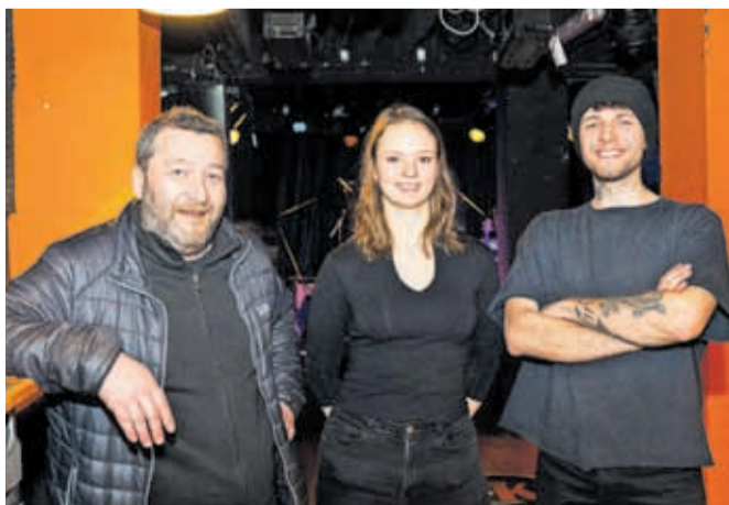
Organizacijska ekipa je poskrbela za pestro januarsko dogajanje.

ali pa preprosto ne vedo, kam bi se podali v dolgih zimskih večerih,« je poudaril Kosec. Matineja je obiskovalcem ponudila več kot le glasbeno izkušnjo. Bila je povabilo k odkrivanju novih zvokov in hkrati k podpori lokalnih glasbenikov. »Želimo prenesti sporočilo, da se lahko družimo, spoznavamo nove ustvarjalce in se ob tem tudi zabavamo. Takšni dogodki so priložnost, da se ljudje povežejo in skupaj premagajo januarsko melanholijo,« je zaključil Kosec.