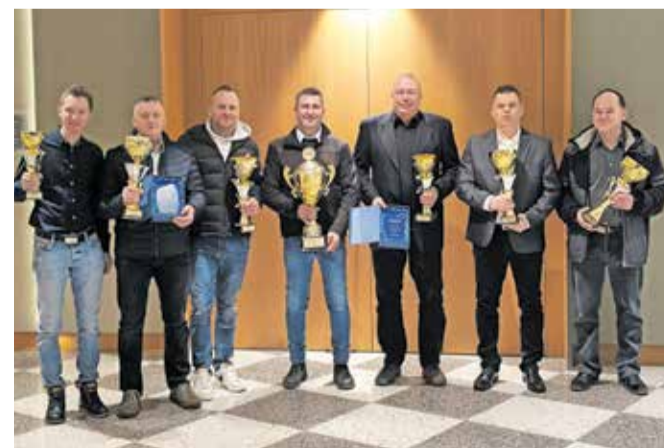
Kamničani so domov odnesli sedem pokalov in dve priznanji.