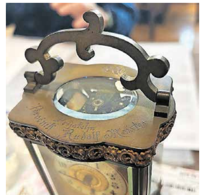
Na vrhu ure sta vgravirana posvetilo in letnica.