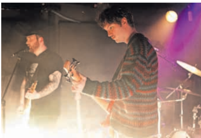
Na drugem večeru sta nastopili zasedbi Lars from Norway in Nikki Louder.

Prvi večer je bil posvečen lokalni pankovski sceni, saj sta nastopili skupini Matilda prihaja in Mejhn. Drugi večer