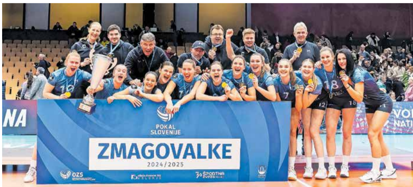
Odbojkarice Calcita Volleyja so petič osvojile pokalno lovoriko.

Odbojkarice Calcita Volleyja so po dveh zaporednih porazih v finalu pokala Slovenije v tretje le strle odpor OTP banke Branika in še petič v zgodovini osvojile dragoceno lovoriko. Njihova zmaga v velenjski Rdeči dvorani je bila čista kot solza, saj nasprotnicam niso oddale niti niza.