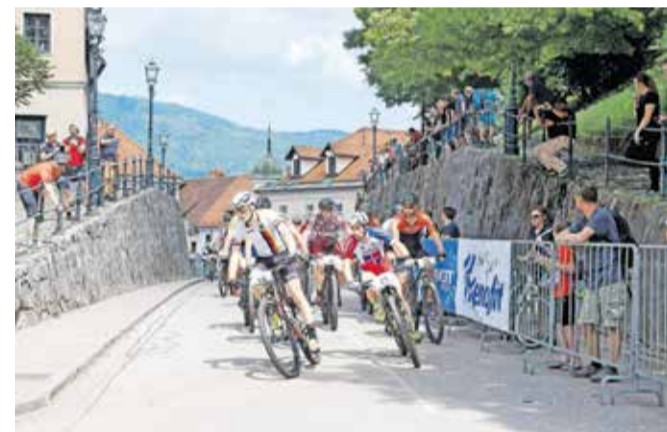
Dirka, ki poteka tudi skozi središče Kamnika, bo tokrat na sporedu 18. maja.

Sredi junija, natančneje 15. junija, bo dirka v Libojah, nato pa 5. in 7. julija državno prvenstvo v kratkem krosu in olimpijskem krosu, ki bo letos v Kočevju. Za konec sezone bo 6. septembra še dirka XC Rašica za mlajše kategorije, amaterje in veterane ter odprto kategorijo.