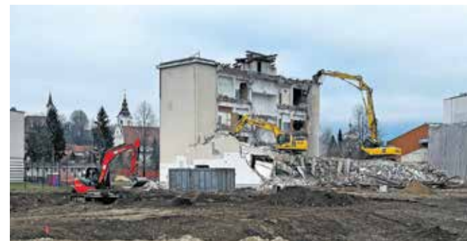
Poteka rušenje starega poslopja Osnovne šole Frana Albrehta.

rušitev preostanka zgradbe. Hkrati poteka tudi gradnja zunanjih površin med obema šolama. Na območju novih parkirišč pod zgradbo nekdanje Metalke so začeli polagati granitne robnike, na delu zunanjih športnih površin pa izkopavajo zemljinu in dovažajo gramoz in kamniti drobljenec. Na območju okrog objekta glasbene šole in knjižnice velja spremenjen prometni režim, vzpostavljena so tudi začasna parkirišča. Upornike javnih ustanov na tem območju zato na občinski upravi prosijo za potrpežljivost in razumevanje.