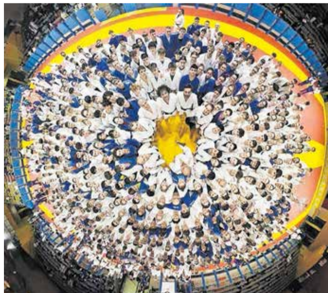
V Lignanu se je zbralo več kot tisoč dvesto udeležencev.

Po zaključku zadnjih treningov v nedeljo popoldne so se udeleženci vrnili domov polni novih znanj, navdiha in motivacije za prihajajočo tekmovalno sezono.