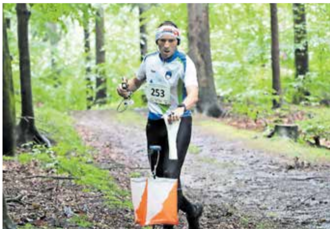
Kamniški radioamaterji so v minulem letu zabeležili več uspehov na tekmovanjih.

ARON je kratica za Amatersko radijsko omrežje za nevarnost, ki predstavlja ključno podporno komunikacijsko infrastrukturo v izrednih razmerah. Gre za omrežje, ki ga upravljajo radioamaterji z namenom zagotavljanja komunikacijske pomoči, ko običajna telekomunikacijska omrežja odpovejo ali postanejo preobremenjena. Takšne situacije vključujejo naravne nesreče, tehnične katastrofe in druge kritične dogodke.