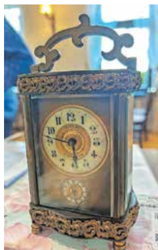
Maistrova ura s konca 19. stoletja