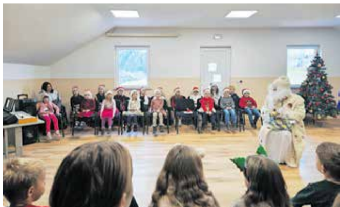
Dedek Mraz je obiskal otroke v krajevni skupnosti Črna.

gram, v katerem so nastopali učenci in učenke Podružnične šole Gozd. Ti so pod mentorstvom učiteljic pripravili zanimiv polurni program, v katerem ni manjkalo predstavitev, recitacij, ugank, glasbe in plesa. Po zaključku nastopa pa so skupaj z ostalimi otroki priklicali Dedka Mraza. Ta je otroke pozdravil in jim voščil lepe božične praznike. Kot se za enega izmed dobrih decembrskih mož spodobi, pa ni prišel praznih rok. S seboj je namreč prinesel darila za 77 otrok iz krajevne skupnosti Črna.