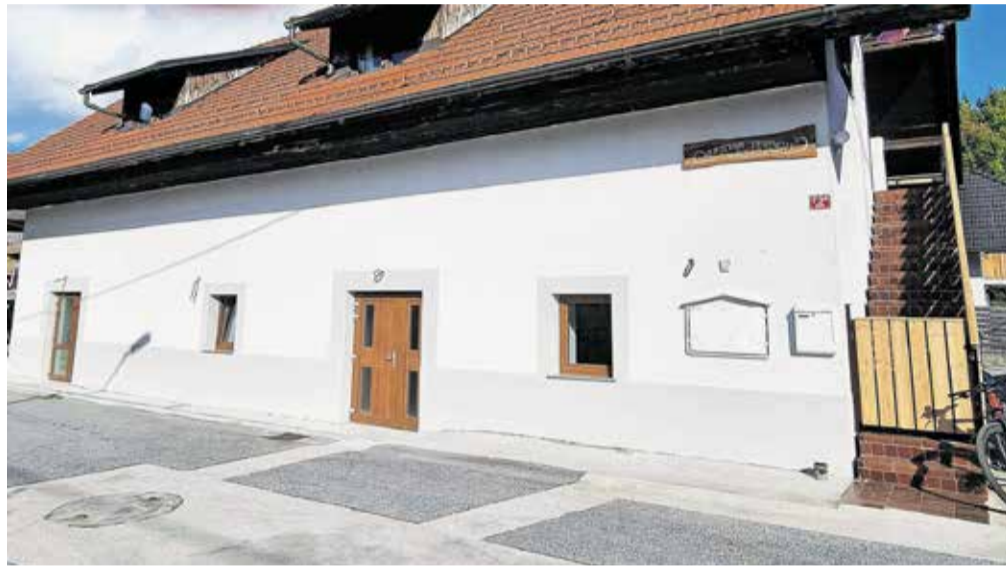
Med obnovljenimi domovi je tudi objekt v Godiču.

»Ponosni smo na to, kako lepa dvorana je v Godiču nastala v nekdanjih prostorih hleva in skladišča, kar si je bilo pred leti skoraj nemogoče predstavljati. Je dokaz, kaj vse se da, ko krajsani in občina stopimo skupaj,« so zadovoljni na občinski upravi.