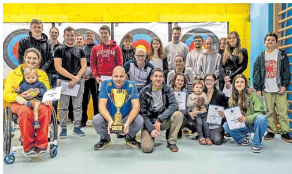
Fotografija kamniških lokostrelcev z lanskoletnega zaključnega srečanja

da klub z inovativnimi pristopi in predanim delom krepi celoten nabor lokostrelcev – od najmlajših do vrhunskih para športnikov. Kot vrhunec evropske sezone je Den Habjan Malavašič postal evropski podprvak. Evropsko prvenstvo, ki pritegne najboljše tekmovalce