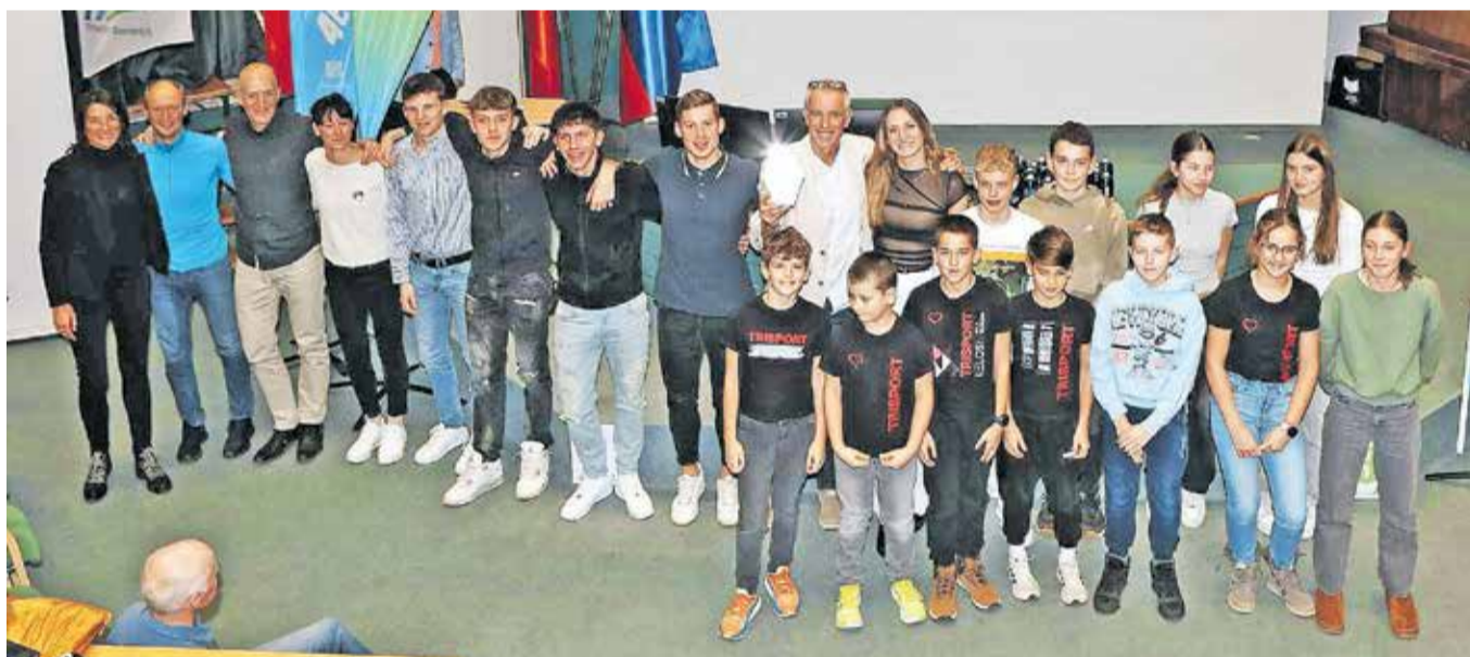
Naziv najuspešnejšega triatlonskega kluba v lanski sezoni je pripadel TK Trisport Lelosi Kamnik.

Šport, Trenert in Olimpija zbere 9.500 točk. Tretji center pa je Ribnica s 6.500 točkami. »Čeprav so sedaj že potihnille govornice o pokritem kamniškem bazenu, kot ga imajo v Ljubljani, Kranju, Novem mestu, Ravnah, Logatcu, Novi Gorici, kamniška kluba vseeno operirata na zavirljivo visoki ravni. Seveda za ceno visokih najemov bazenskih prog v Termah Snovik in Cirusu ter vsakodnevnih prevozov do Ljubljane ali Kranja. Do kdaj še tako?« se sprašujejo v kamniškem klubu.