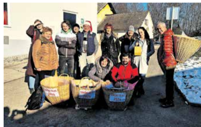
V Tunjicah so pred kratkim prejeli jubilejno, trideseto številko vaškega glasila. / FOTO: TATJANA LIPOVŠEK

Na praznični četrtek, 26. decembra 2024, smo se zbrali koledniki – člani uredništva Tunški glas in prostovoljci, da bi kot vsako leto raznosili glasilo po domovih. V zgo-