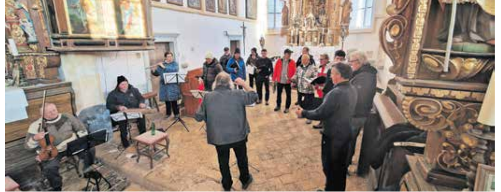
Pevci PSPD Lira vsako leto 30. decembra izvajamo pevske jaslice v cerkvi sv. Primoža.