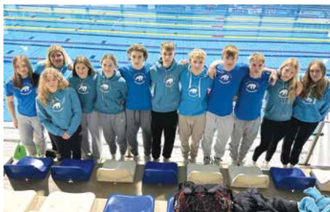
Calcitovi plavalci so leto zaključili na najboljši možen način.

Maribor – Na mariborskem kopališču Pristan je v olimpijskem bazenu od petka, 20., do nedelje, 22. decembra, potekal pokal Slovenije in absolutno državno prvenstvo Slovenije 2024. Za nastop na tekmovanju mora vsak plavalec na predhodnih tekmovanjih doseči minimalni kriterij za nastop, ki ga določa Plavalna zveza Slovenije. Kriterij za nastop na tem tekmovanju je doseglo 227 plavalcev in plavalk iz 24 plavalnih klubov. Za plavalni klub Calcit Kamnik jih je nastopilo dvanajst pod vodstvom trenerja Mihe Potoč-