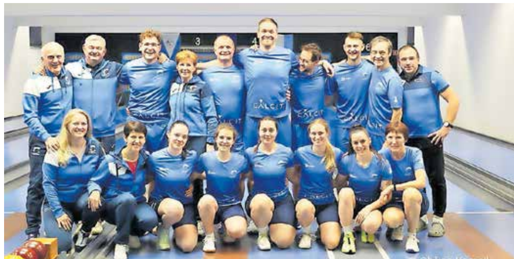
Kamniški kegljaški klub je praznoval sedemdeset let.

Tako kot pri vseh športnih klubih, še posebej pri takšnih z bogato in dolgo zgodovino, je prihajalo do vzponov in padcev. Zagotovo je bil obstoj kluba najbolj ogrožen leta 1997, ko je kegljaški klub ostal brez svojega kegljišča. Po letih gostovanj na drugih kegljiščih se je krivulja obrnila navzgor leta 2005. Avgusta je svoja vrata odprlo novo kegljišče pri stadionu Mekinje, od takrat naprej