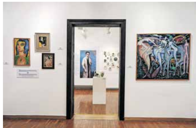
V prenovljeni postavitvi tokrat izstopajo tako Maleševa slikarska dela kot njegov ustvarjalni opus umetniške keramike.