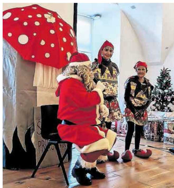
Božiček med člani Društva Sožitje Kamnik

Mekinje – Prav na ta dan je člane Društva Sožitje Kamnik obiskal Božiček. Pričakali smo ga v Samostanu Mekinje, ki ga je v mrzlem zimskem jutru objemal venec zasneženih gora. V skoraj pravljicnem vzdušju so veliko dvorano samostana napolnili prav posebni ljudje, ljudje odprtih src, toplih objemov, odkritih nasmehov, takšni, ki še vedno znajo imeti iskreno radi. Čakanje na prihod Božička nam je krajšala avtorska igrice Družinskega gledališča Kolenc z naslovom Škratka na delu. Poučna zgodbica, v kateri smo se skozi škratje dogodivščine naučili, da nagaivost, ki jo včasih naredimo drugemu, lahko tudi boli. Zato ostanimo ali postanimo raje dobri, prijazni in ponudimo pomoč, kadar jo kdo potrebuje, saj si želimo, da bi bili takšni tudi drugi do nas. Škratka sta bila nagrajena z bučnim aplavzom in takoj