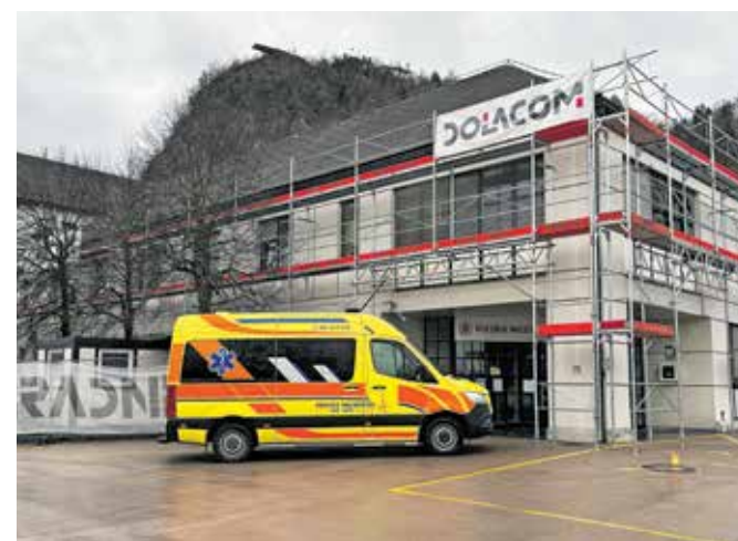
V kamniškem zdravstvenem domu urejajo dodatne prostore.

lo pediatričnih ambulant se je povečalo z dveh na pet, ginekoloških z ene na tri, namesto enega sta zdaj dva ra-