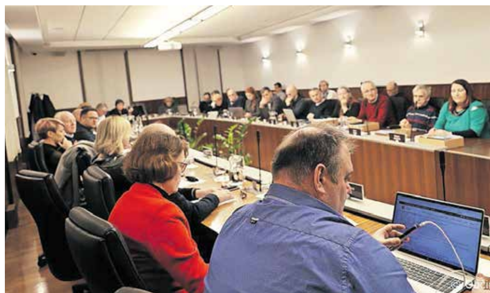
Svetniki so se decembra zbrali še zadnjič v minulem letu.

Nato je sledila še druga obravnava odloka o proračunu za letošnje leto, ki so ga svetniki sicer pretresali na prejšnji seji. Po krajši