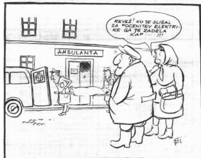
Cenejša elektrika; karikatura Bojana Schlegla, objavljena v Kamniškem občanu (1965, letnik 4, št. 1)

Živimo v času nerazumnih podražitev in zdi se, kot da nas nič več ne more presenetiti. Vse nekako stoično prenašamo – za razliko od takratnih občanov, ko je nemalo razburjenja povzročila »ne preveč razveseljiva novica« o precejšnjem dvigu cen dimnikarskih storitev. Najbrž tisto zimo niso kaj dosti vrteli gumbov. Presenetljivo – dočkali pa so pocenitev elektrike! Vsem bralcem želim obilo pozitivnih presenečenj v letu 2025!