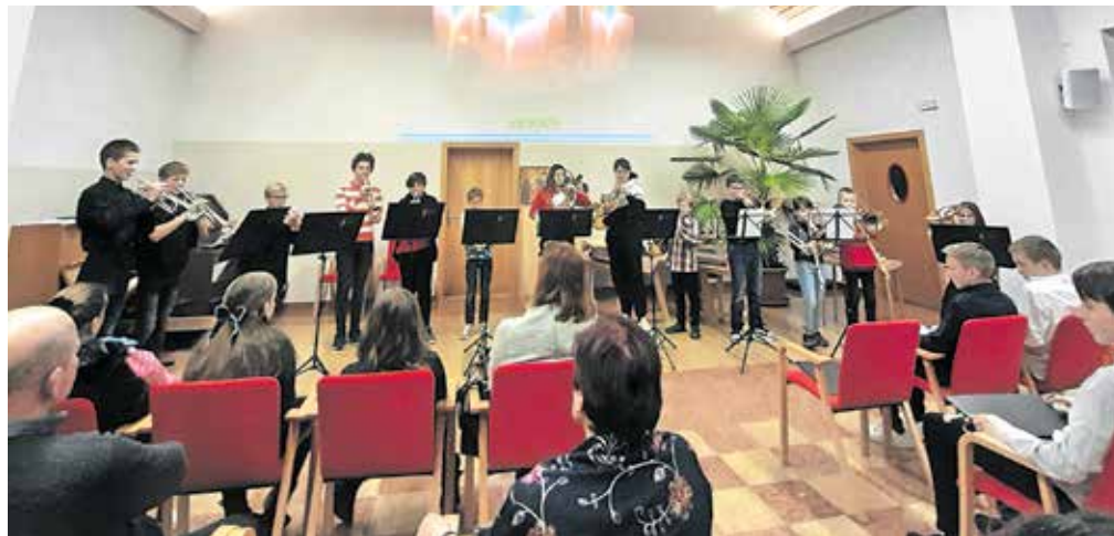
Koncert učencev Glasbene šole Kamnik pri frančiškanih