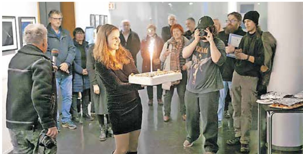
Kamniški fotografi so praznovali dvajseti rojstni dan.