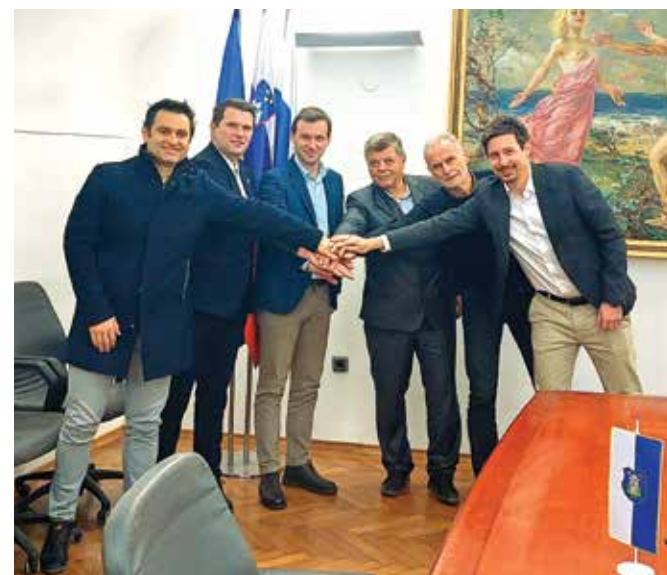
Ob slovesnem podpisu pogodbe za organizacijo evropskega prvenstva v gorskih tekih in trailu 2026