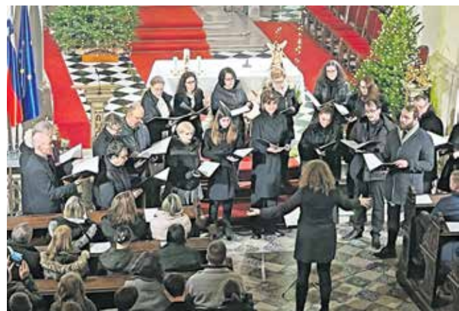
Božični koncert Mešanega pevskega zbora Cantemus iz Kamnika

polnih 46 let, članstvo se je z leti spreminjalo, občasno pomlajevalo, pridobilo je prepoznavnost in kvaliteto, vztrajnost je bila poplačana. Letos je njihovo prizadevanje za ohranitev slovenske narodne/ljudske pesmi dobilo tudi uradno mednarodno potrditev, na kar so izjemno ponosni. Na festivalu Bratislava cantat II 2024 so zasluženo prejeli zlato priznanje v kategoriji narodnih pesmi v izvedbi a cappella, kar jih je pozitivno motiviralo za nadaljnje projekte. Nemudoma so začeli priprave ter v novembru v počastitev sokrajana generala Rudolfa Maistra v dvorani Samostana Mekinje izvedli slavnostni Maistrov koncert. Advent in božični čas sta vsako leto namenjena tradicionalnim dejavnostim, zato pevci Cantemusa z veseljem in navdušenjem poslušalce in sebe nagradijo s tradicionalnim koncertom božičnih pesmi. Če jih želite v času do svečnice ponovno slišati, boste imeli priložnost v nedeljo, 12. januarja, v cerkvi svetega Petra v Komendi po 10. maši in v nedeljo, 19. januarja, v cerkvi Device Marije v Šinkovem Turnu med sveto mašo ob 9.30 in na koncertu po njej.