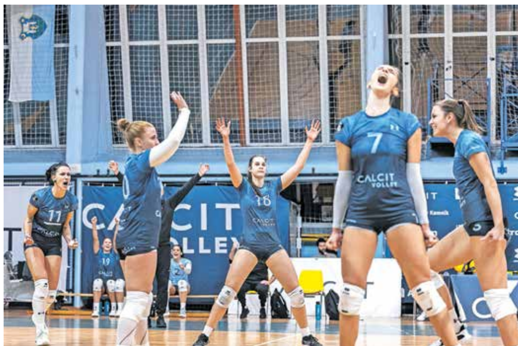
V nedeljo bo v Velenju prvi vrhunec sezone za kamniške odbojkarice.

Ob koncu lanskega leta so bile mariborske odbojkarice v manjši krizi, saj so ob Kamničankah izgubile tudi proti GEN-I Volleyju, tako