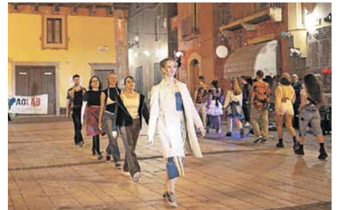
Slovenski udeleženci izmenjave so na modni reviji pokazali svoje izdelke.

Na izmenjavi pa je bilo veliko govora tudi o počasni modi, glavni temi tokratne izmenjave. »Izdelki, ki spadajo v to kategorijo, so narejeni iz lokalnih materialov ali so jih izdelali lokalni ustvarjalci, a so zato pogosto precej dražji in si jih težje privoščimo,« pojasni Urankarjeva. »Zato smo udeleženci skupaj naredili seznam, ki nam bo pomagal ustvariti prihodnost z manj zavrženimi oblačili. Priporočamo, da namesto