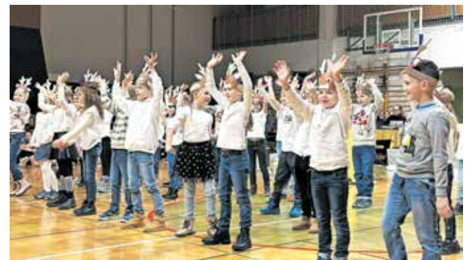
Učenci Osnovne šole Stranje

Z dobrimi željami in upanjem smo vstopili v leto 2025. Učenci in učitelji si želimo predvsem odličnih šolskih uspehov, mirnih odmorov in čim več znanja.