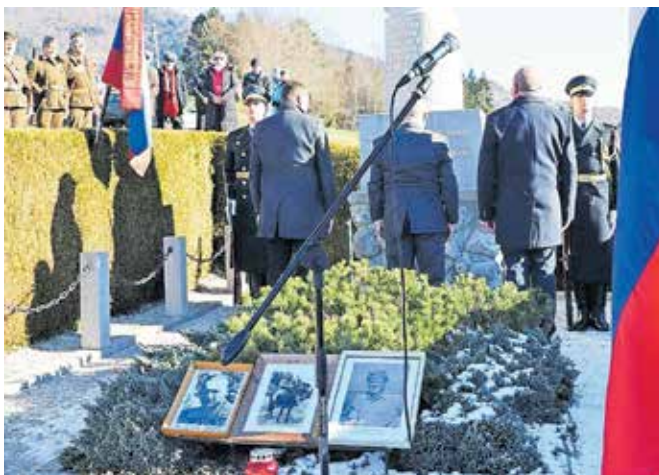
Poklon padlim borcem na Prevojah v Zgornjem Tuhinju