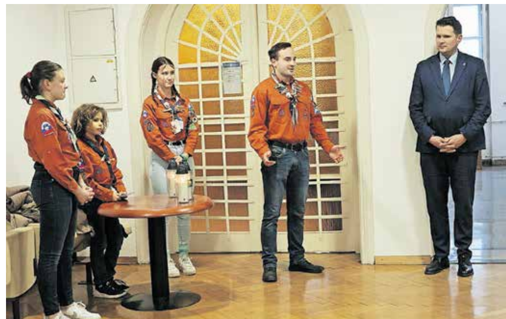
Kot je v navadi, so tudi tokrat pred zadnjo sejo občinskega sveta v letu svetnike obiskali kamniški skavti in prinesli plamen Luči miru iz Betlehema.