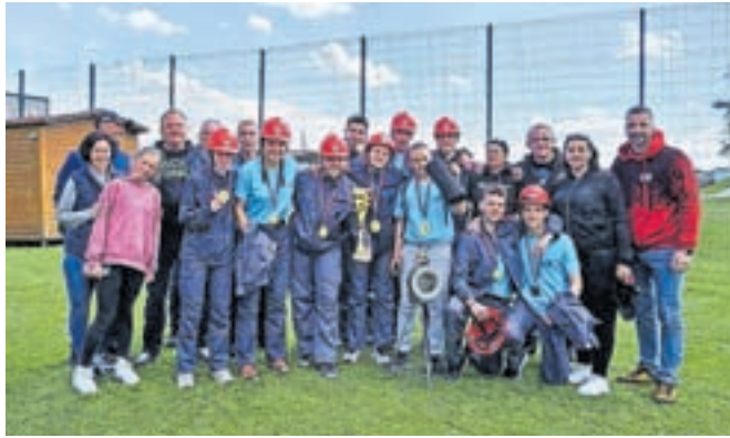
Ekipa mladincev PGD Zgornji Tuhinj je bila uspešna na izbirnem tekmovanju za mladinsko gasilsko olimpijado 2024.

Slovenska Bistrica – V Slovenski Bistrici je aprila potekalo izbirno tekmovanje za letošnjo mladinsko gasilsko olimpijado, ki se ga je udeležila tudi ekipa mladincev PGD Zgornji Tuhinj. Sodelovalo je 11 tekmovalnih enot mladincev, 11 tekmovalnih enot mladink in tekmovalna enota mladincev PGD Drenov Grič - Lesno Brdo kot zmagovalna enota gasilske olimpijade 2022 v Celju. Mladinci PGD Zgornji Tuhinj so postali absolutni zmagovalci izbirnega tekmovanja, s čimer so se uvrstili v nadaljnje priprave za nastop na mladinski gasilski olimpijadi, ki bo med 21. in 28. julijem v Italiji.