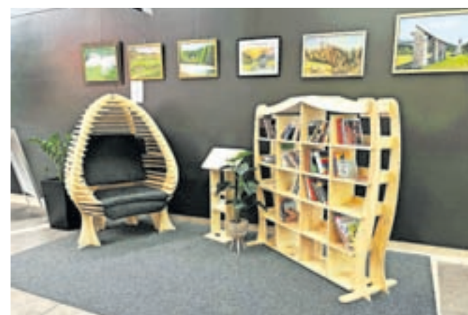
Knjigobežnica z lesenima knjižnim policičnikom in bralnim stolom