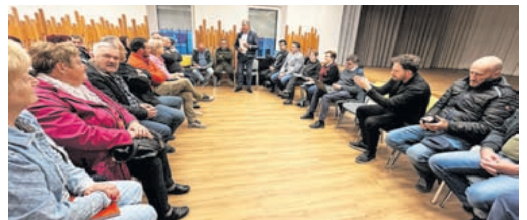
Sestanek deležnikov razvoja Tuhinjske doline / FOTO: ALEŠ SENOŽETNIK

V počastitev tridesetletnice bodo v Tuhinjski dolini pripravili zbornik, v katerem bodo zaokrožili zadnjih tride-