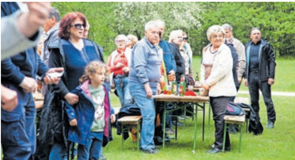
V Kamniški Bistrici se je znova zbralo precej ljudi.

»V naši družbi imamo ljudi, ki jih imajo mnogi za uspešne podjetnike, a vemo, da so njim in njihovim družinam odpisali desetine milijonov evrov dolga, in imamo podjetnike, ki služijo na račun države tako, da se z enim ali drugim nižjim funkcionarjem na ministrstvu dogovorijo, da bodo bogato kupili in preplačali stavbo, ki ne bo nikoli ničemu služila,« je nadaljeval Hojs, ki je poudaril vlogo države, katere pomen ni le pomagati ljudem v socialni stiski, temveč tudi odigrati svojo vlogo na področju policije, sodstva in tožilstva, da bodo tovrstne malverzacije sankcionirane. »Takrat bomo lahko v polnosti rekli, da rek Delu čast in oblast tudi pri nas velja,« je še povedal.