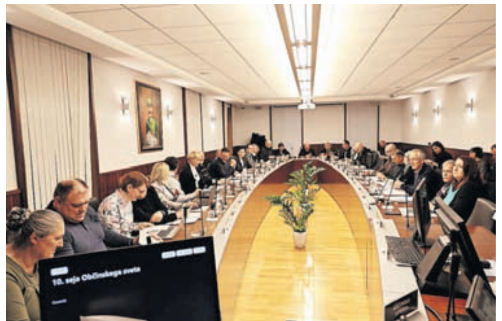
Svetniki so razpravljali na deseti redni seji.

Župan je odgovoril tudi na očitke svetnikov, da je na planini turizem prevladal nad ohranjanjem narave. Pri tem so svetniki spomnili predvsem na dva aprilska sončna konca tedna, ko je zaradi velikega obiska prišlo do prometnih zastojev na cesti proti Kranjskemu Raku. »Velika planina je veliko bolj urejena kot prej. Cesta je as-