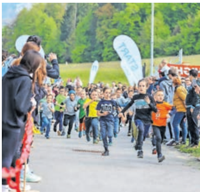
Letošnje 34. izvedbe Mekinjskega krosa se je udeležilo več kot sto petdeset otrok.