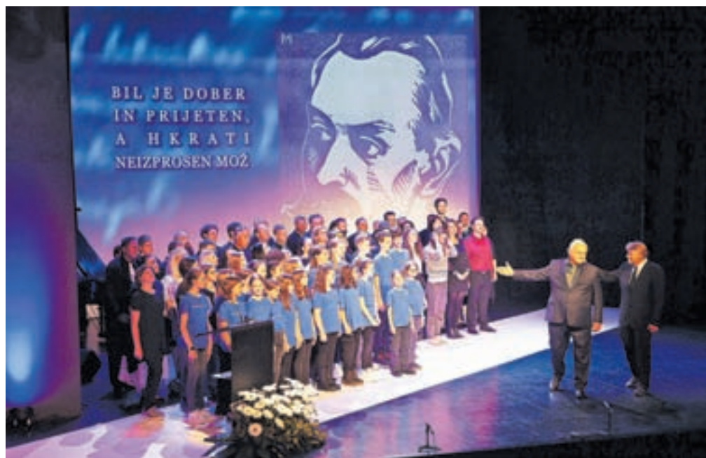
Del akademije je bil tudi izjemen kulturni program.