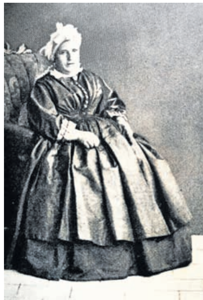
Fotografija Pepčkove stare mame v knjižici spominov na Kamnik, 1928

»Zakaj obujati k življenju, kar je bilo, kar je prešlo? Zakaj dramiti mrtve iz pokojnega sna? Pepček se zaveda, kako težko nalogo si je nadel. Pa – quand même! (vseeno, op. a.) Zakaj? Da bi v teh spominih na minula leta še enkrat sam oživel, še enkrat užival in obujal idilo patriarhalnih kamniških dni polpretekle dobe. To nalogo je dosegel.« In če boste prebrali Pepčkove spomine, jo boste dosegli tudi vi.