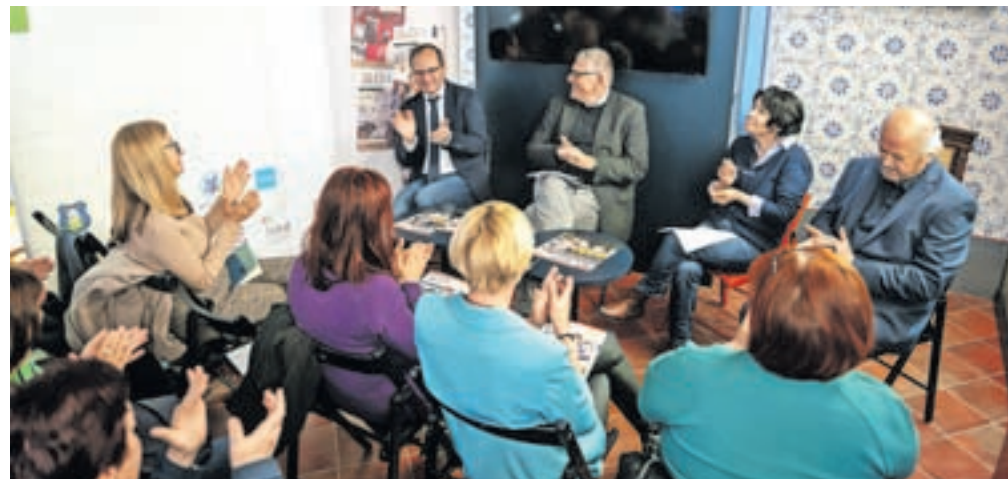
Ob predstavitvi tematske številke o Rudolfu Maistru - Vojanovu