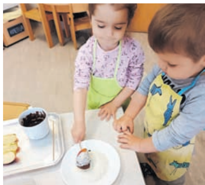
Iz jabolka smo ustvarili jabolčne lizike.

Človek je del narave in s svojim ravnanjem nanjo zelo močno vpliva, zato je pravno varstvo narave družbeni dogovor, ki v svojem temelju predstavlja prizadevanje za ohranjanje človekovega zdravja in dobrobiti.