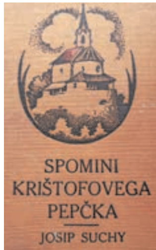
Naslovnica knjižice Spomini Krištofovega Pepčka, 1928