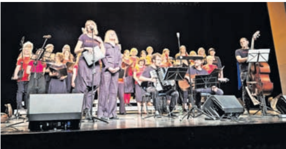
Koncert ženskega pevskega zbora Kombinat v Domu kulture Kamnik