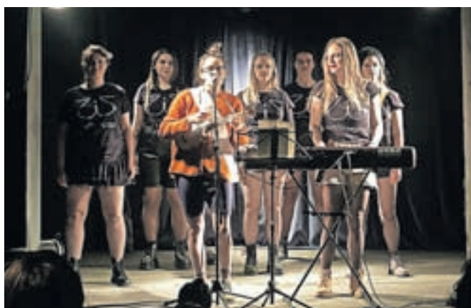
ZIZ kabaret

ZIZ iz Maribora in društvom Priden možic. Pojasni: »Kamniki se še vedno pozna, da smo pred desetimi leti obudili kabaretno dejavnost. Takrat z legendarnim Katzen kabaretno, ki je imel v več letih kar tri edicije: Vojna, Odvisnost in Migracije. Z njim smo tudi gostovali po Sloveniji. Kasneje je v Kamniku