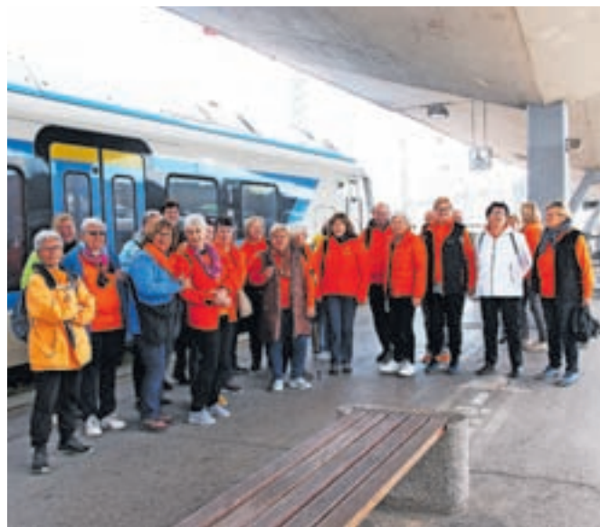
Člani kamniških skupin Šole zdravja smo se podali na izlet v Ljubljano.

drugačen. Plovba nas je zanesla vse do Krajinskega parka Ljubljansko barje, Črne vasi, Plečnikove cerkve na Barju. Vseskozi nas je spremljal čudovit pogled na zelene rečne bregove, številne ptice in rečne živali. Ko smo se vračali, pa nam je