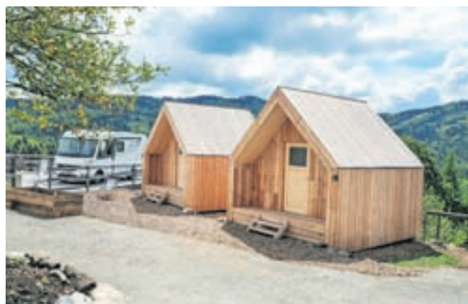
Hišici s posteljama so izdelali sami v sodelovanju z lokalnim mizarjem.

Gostom in obiskovalcem želijo dolino in njeno okolico približati kot destinacijo, ki ponuja veliko možnosti za doživetja, zlasti za aktivnosti na prostem. »Zato poleg nastanitve ponujamo tudi e-kolesa, kolesarske in pohodniške ture. Golice so dobro izhodišče za vzpon na Menino planino. Za zahtevnejše ture in plezanje v Kamniško-Savinjskih Alpah sodelujemo s Planinskim društvom Kamnik in kamniškimi gorskimi vodniki.«