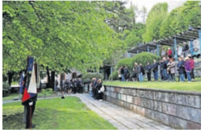
Slovesnost ob dnevu upora proti okupatorju v Parku Evropa