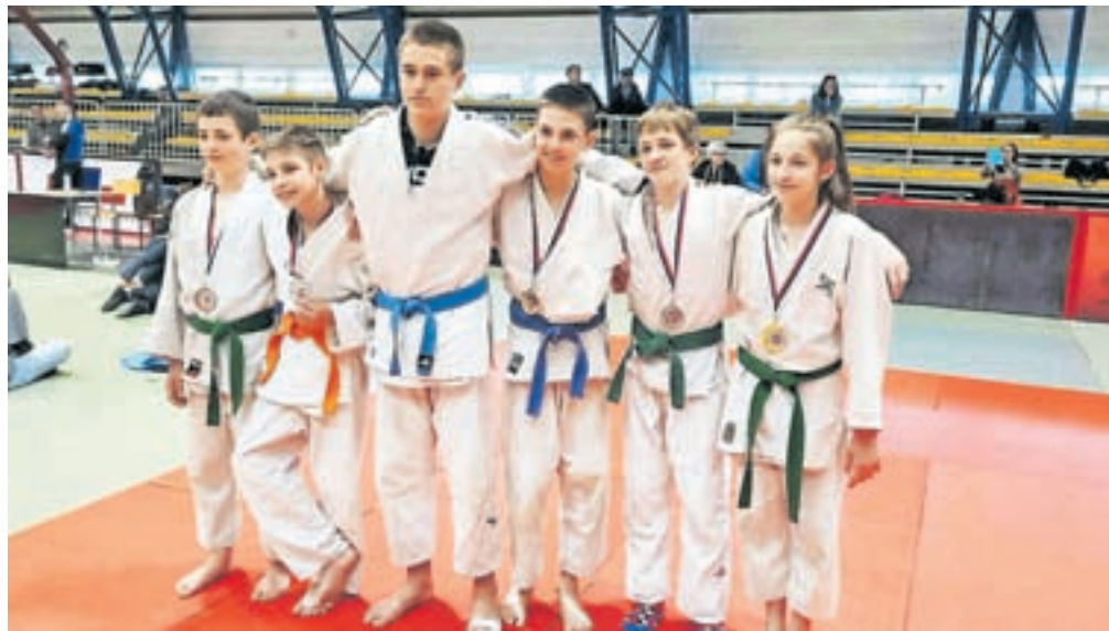
Judoisti Judo kluba Ippon Kamnik na Pokalu Bežigrada