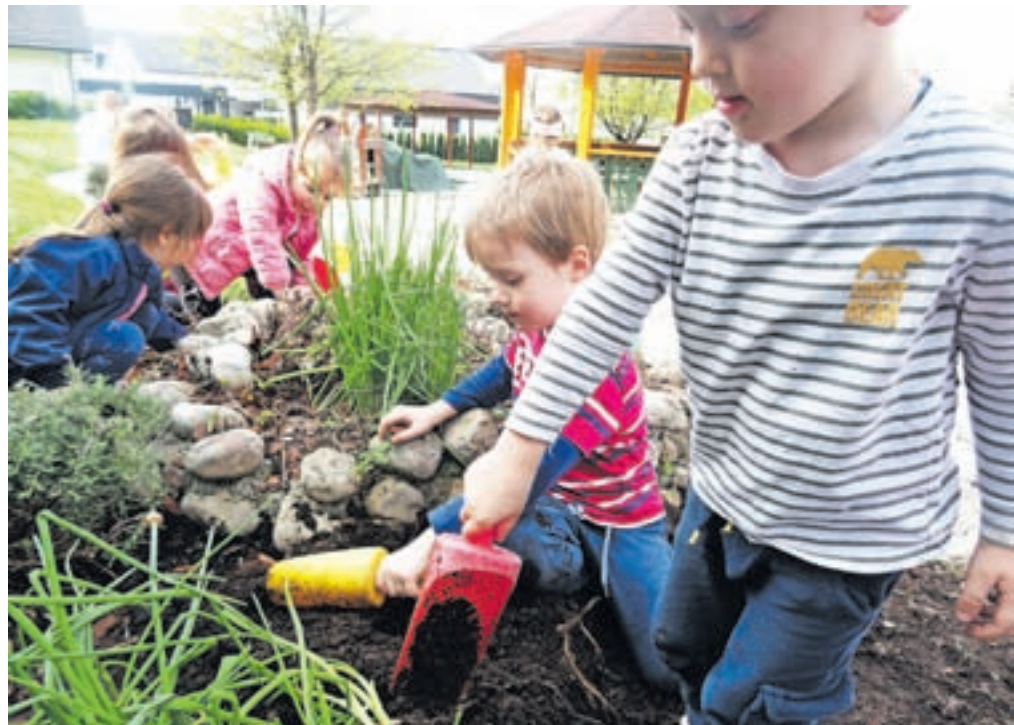
Otroci so v predšolskem obdobju zelo dojemljivi za izkustveno učenje.

Naš vrtec je vključen v več projektov in eden izmed njih je Vrtčevski ekovrt – ŠEV, kjer pridobivamo znanja in smernice, kako najbolj naravno pridobiti semena, jih vzgajati, skrbeti za vrtičke v vseh letnih časih, gospodarno ravnati z vodo in zalivati z deževnico. Hrano, ki jo pridelamo na vrtčevskih ekovrtičkih, otroci skupaj z vzgojiteljicami in kuharicami pripravijo ter z velikim veseljem tudi pojejo. Skupaj z otroki smo se na ta dogodek začeli pripravljati že v začetku marca. Glede na slovenske pokrajine smo posejali semena v lončke in jih v igralnicah opazovali in negovali z zalivanjem. Naša stojnica s Štafeto semen je bila založena z belokranjskim in ptujskim čebulčkom (lūkcom), nanoškimi in ljubljanskim zeljem, solato ljubljansko ledenko, zgodnjim krompirjem, vinogradniško breskvijo, bučami golicami, fižolom sivčkom in maslencem, domačimi zelišči (borreč, kamilice, ognjič, meta, melisa, drobnjak), številnimi rožami, kot so žametnice (ta-